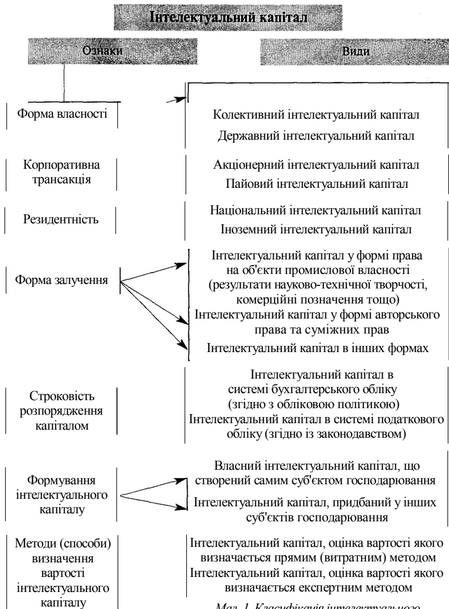
Мал. 1. Класифікація інтелектуального капіталу за ознаками та видами