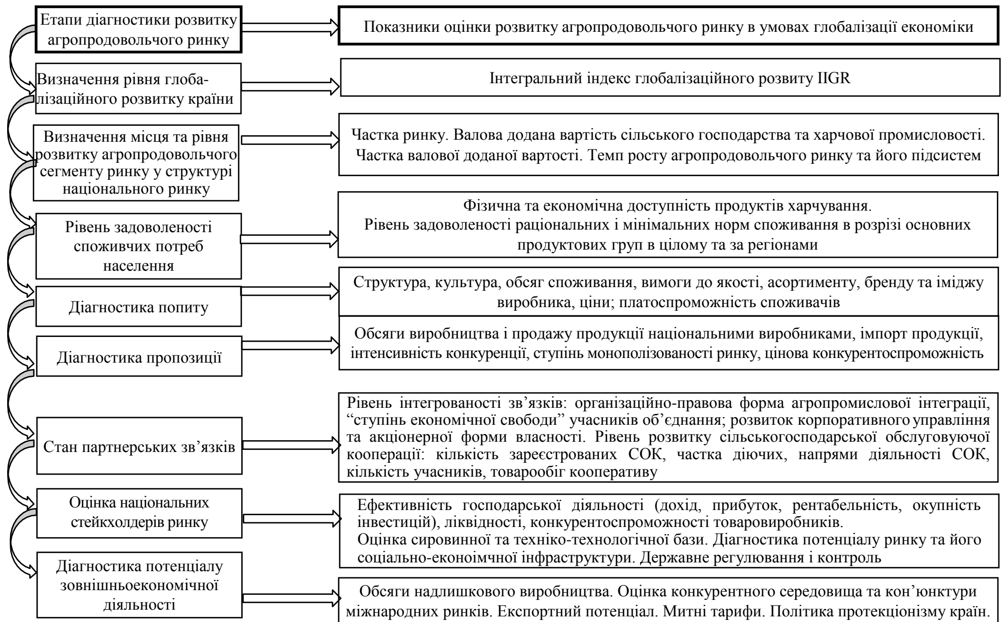
Рис. 2.5. Етапи процесу діагностики агропродовольчого ринку в умовах глобалізації економіки