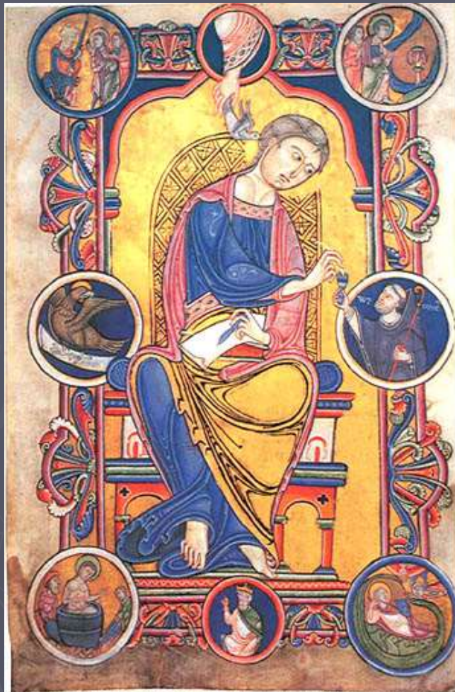
Св. евангелист Иоанн из Евангелия аббата Ведрикуса. Не ранее 1147г. Общество археологии и истории. Авер-сюр-Эльп, Франция.

Мистецтво скульптури і розпису було пов'язане з мистецтвом книжкової мініатюри , розквіт якої доводиться на романську епоху