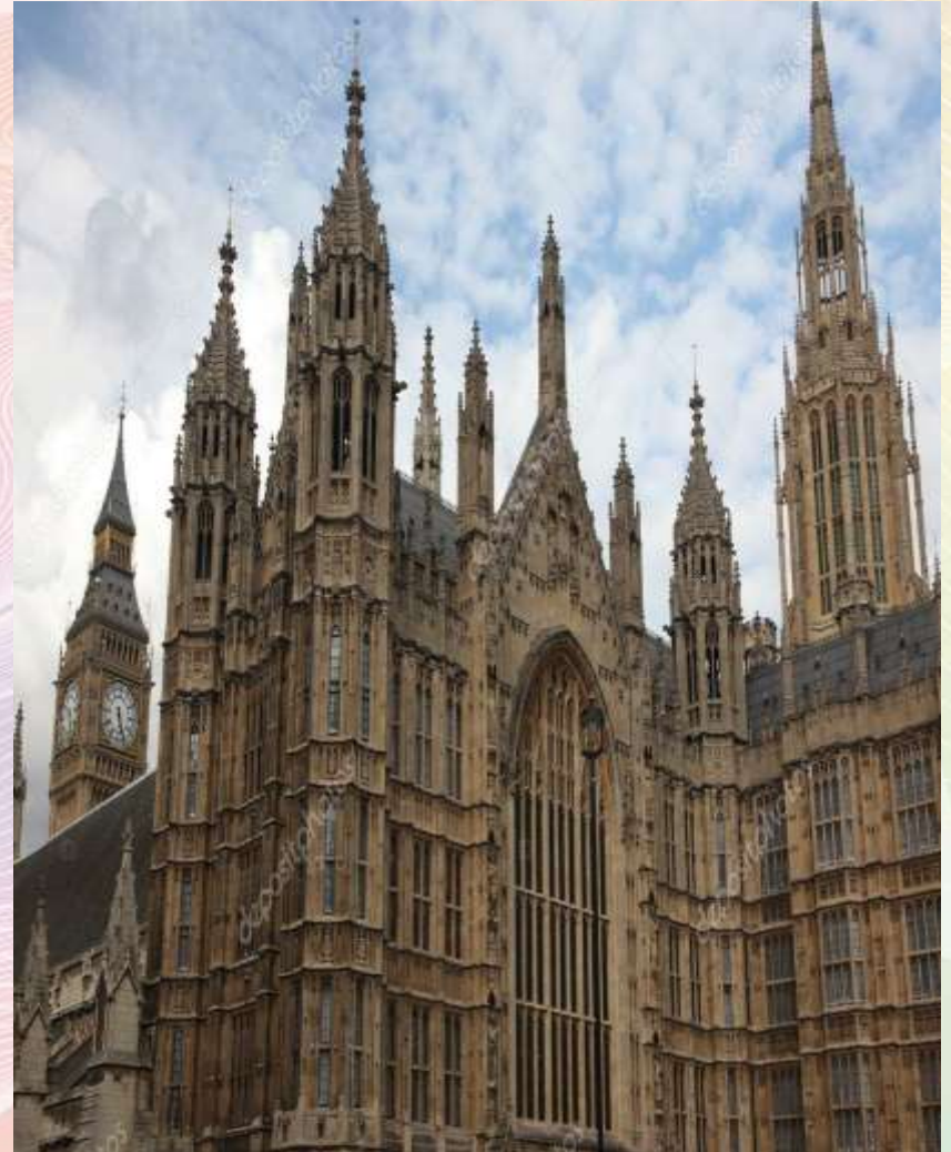
Будинок парламенту, Вестмінстерського палацу, Лондон

найвеличнішою будівлею готичної архітектури є собор — символ багатства й могутності міста. Готичні собори були величними, спрямованими до висоти небес. Якщо в романському храмі склепіння спиралося на товсті стіни, то в готичному соборі — на арки, які трималися на стовпах. Це робило споруду просторішою і світлішою.