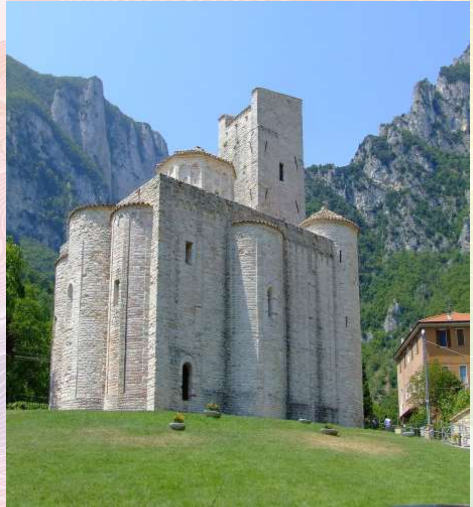
Абатство Св. Віктора, Італія

Романський стиль вирізнявся масивністю і зовнішньою суворістю споруд, які зберігають оборонні, захисні функції. Найбільша увага приділялася спорудженню храмів-фортець , монастирів-фортець , замків-фортець . Згодом почали прикрашати фасади таких споруд за допомогою перспективних порталів, різьблених капітелей, рельєфів і, скульптур, якими