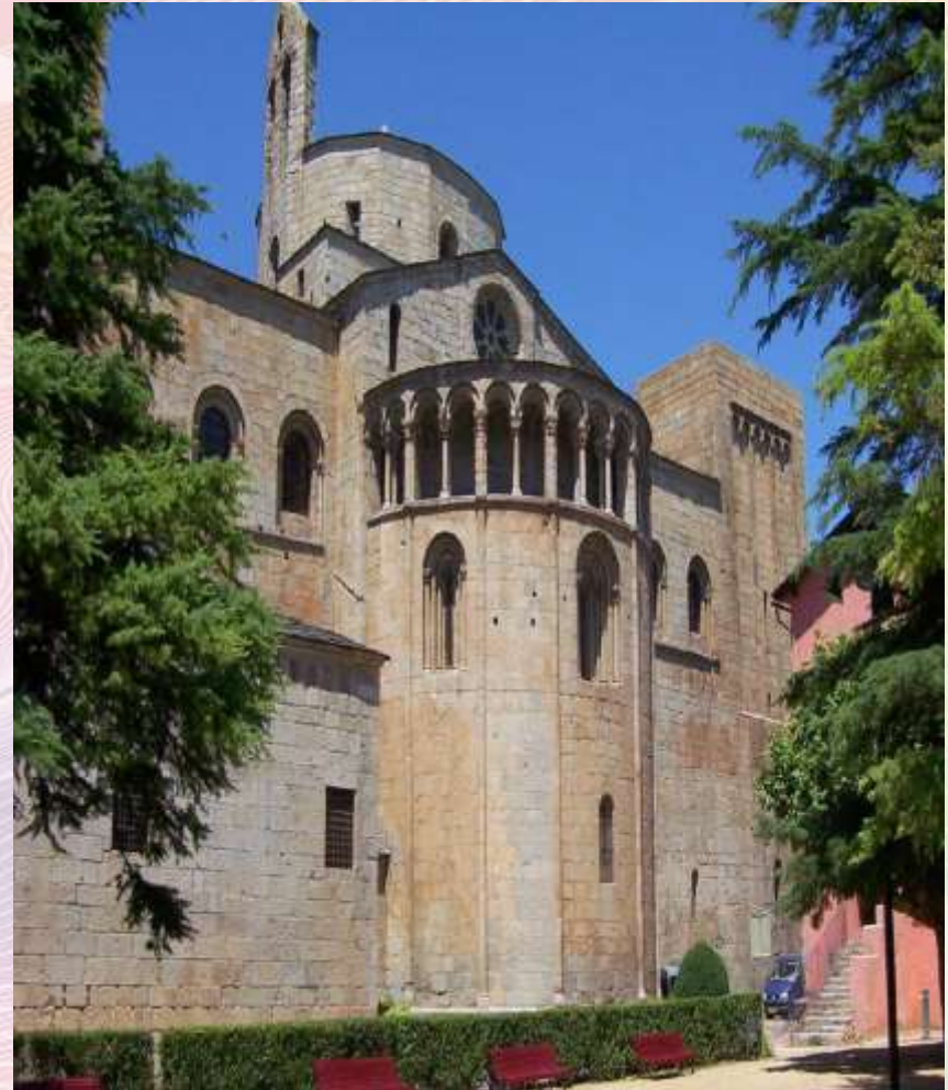
Монастир в Ла-Сеу-д'Уржел , Іспанія

Романський стиль — перший загальноєвропейський стиль в архітектурі (X-XII (XIII) ст.), для якого характерні масивні споруди-фортеці.