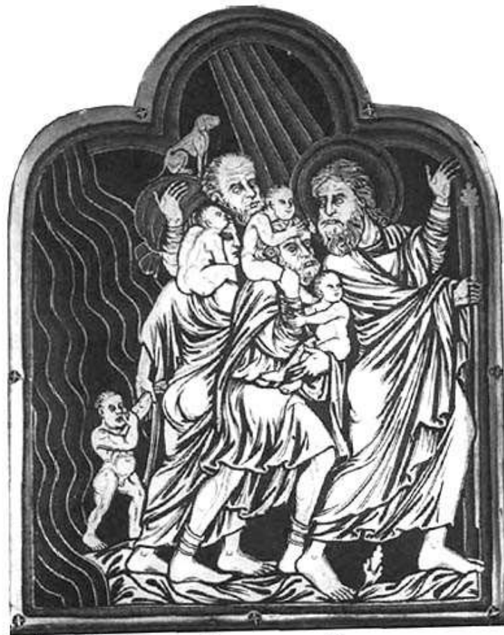
Николай из Вердена. Переход через Черное море из Klosterneuburgского алтаря. 1181г. Эмаль по золоту. Klosterneuburgское аббатство. Австрия.