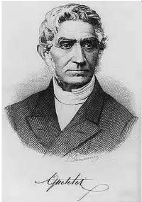
Ламбер Адольф Жак Кетле (1796–1874)

Засновника соціальної філософії визначити важко. В XVI ст. вперше в обігу з'являється термін «соціальна фізика». Суспільствознавство фактично вважалось частиною «фізики». Даний термін вживався включно до другої половини XIX століття. Його використовували знаменитий дослідник статистичних закономірностей в суспільстві Ламбер Адольф Жак Кетле (1796–1874) та засновник філософії позитивізму Огюст Конт, хоча останній з часом почав використовувати термін «соціологія».