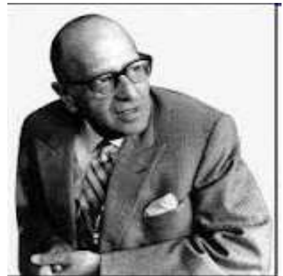
Макс Горкгаймер (1895–1973)