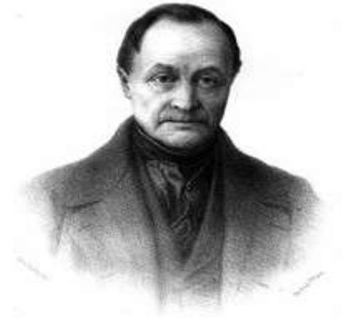
Огюст Конт (1796–1874)

Термін «соціальна філософія» вперше застосував німецький філософ, відомий представник «франкфуртської школи» Макс Горкгаймер.