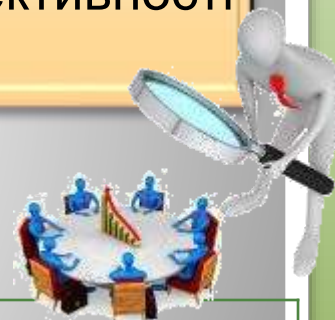
Таблиця 5. Показники ефективності проекту

Оцінка ефективності та інвестиційної привабливості проекту заснована на детальному аналізі фінансового плану, грошових потоків, а також простих та інтегральних показників ефективності (табл.1).