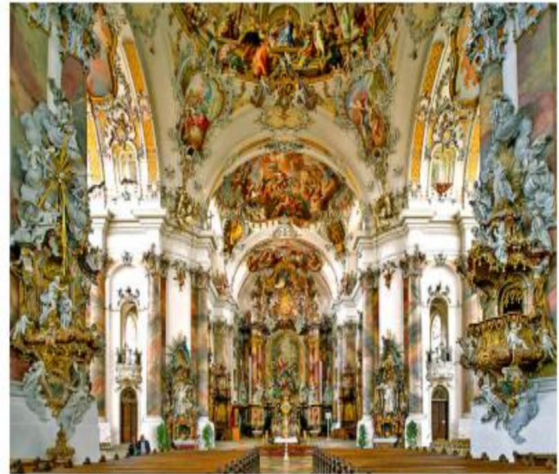
Монастир в Оттобойрені, Німеччина (Баварія)