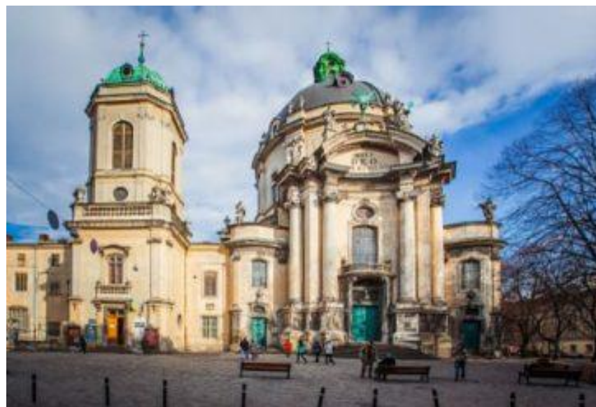
Домініканський собор у Львові