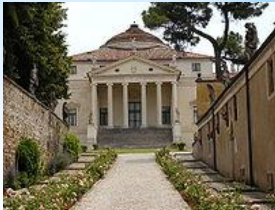
Вілла збоку саду і службових флігелів.