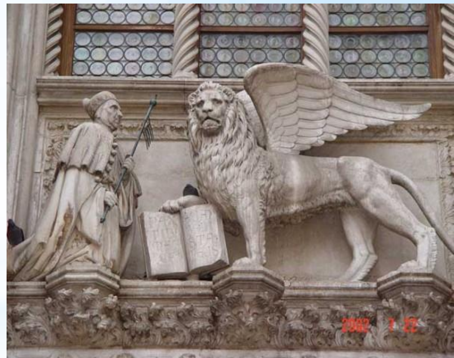
Venedig Palazzo Vendramin-Calergi Mauro Codussi 1500-1509