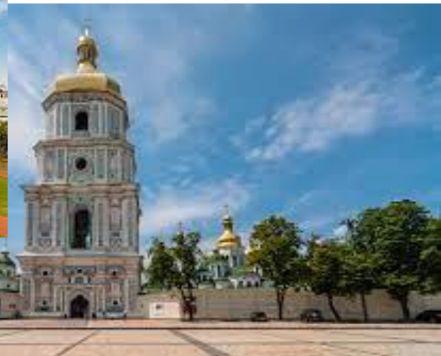
Дзвіниця Софійського собору в Києві XVIII-XIX вв.