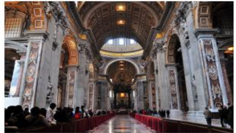
Ренесанс. Собор Святого Петра в Римі, Італія