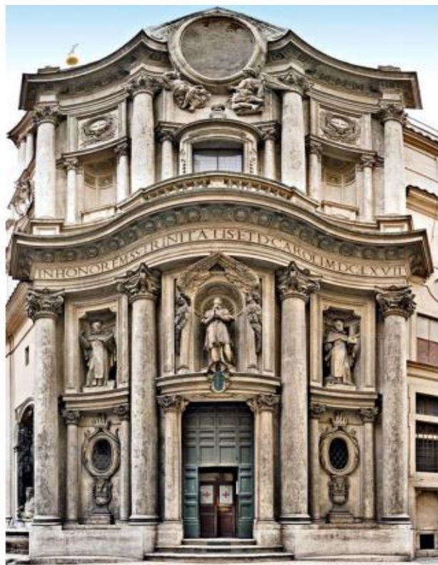
Церква Сан-Карло алле Кваттро Фонтане в Римі, Італія