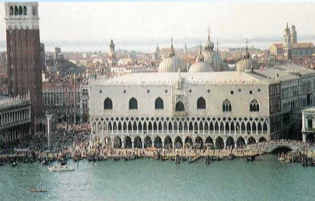
Палац дожів (Венеція, Італія)

Архітектура Відродження за межами Італії була менш послідовна в подоланні середньовічної традиції і проходила складну тривалу еволюцію. У розвитку ж архітектури Відродження Італії прийнято виділяти 3 періоди: ранній (кінець XIV—XV століття), високий (кінець XV-середина XVI століття) та пізній (середина — кінець XVI століття).