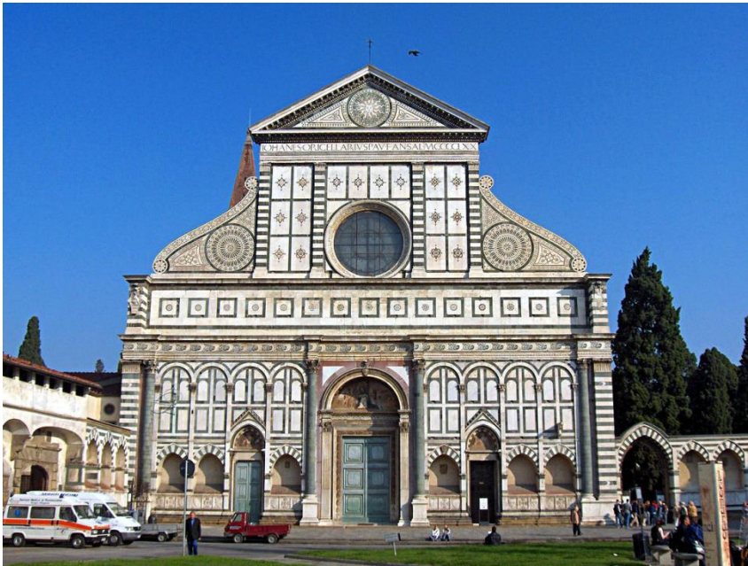
Фасад церкви Базилика Санта Марія Новела у Флоренції