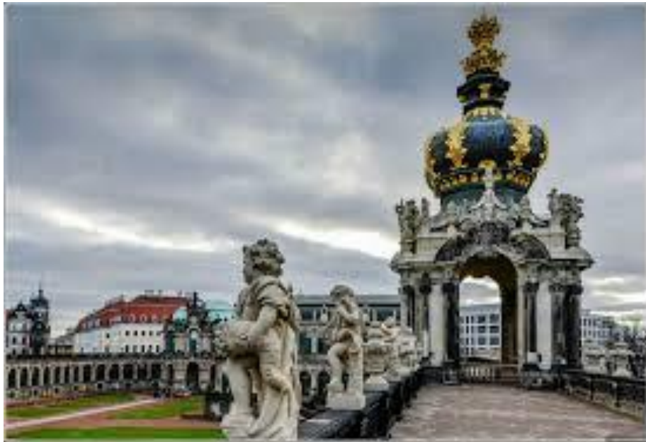
Дрезденський Цвінгер (Німеччина)