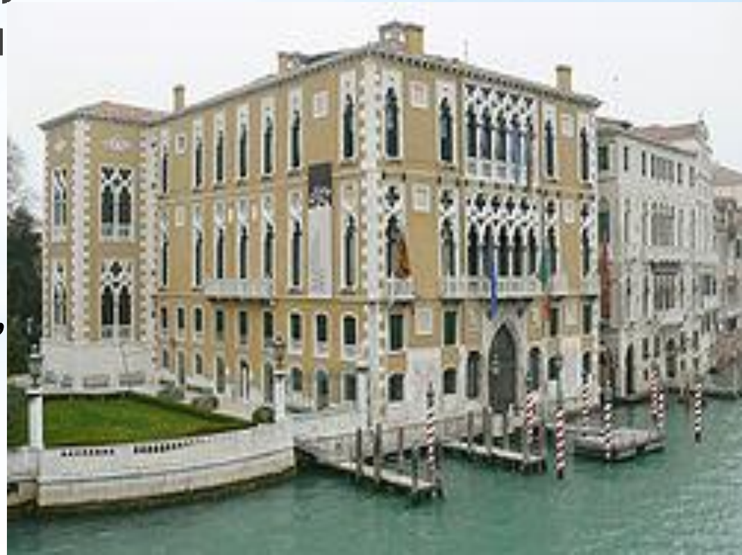
Палаццо Каваллі-Франкетті, Венеція

* Палаццо — тип будинку-палацу, в якому кожному елементу притаманна виражена закінченість, що виявляється і в зосередженості будівлі навколо замкнутого симетричного подвір'я симетрії фасаду.