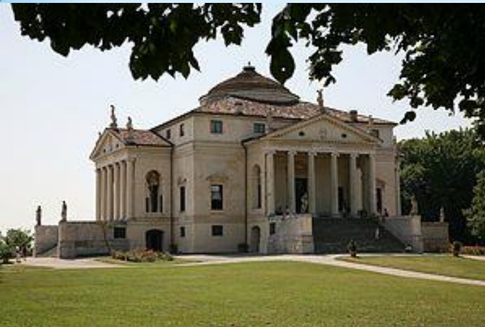
Вілла Ротонда у Віченці, архітектор Палладіо. (пізній період)